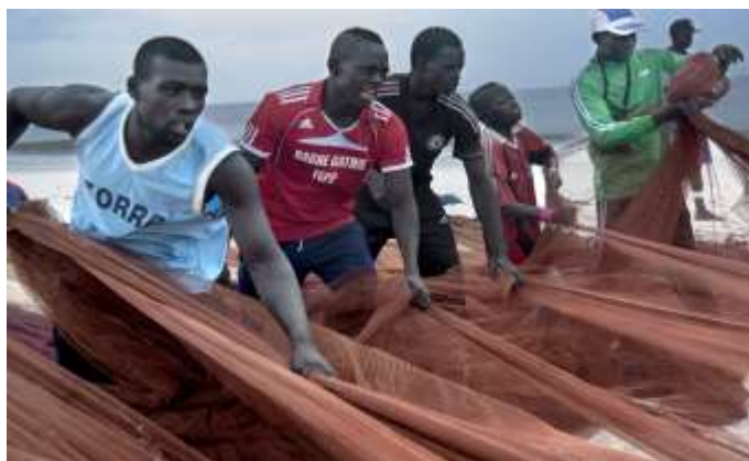
Planche 22 Plage de M'Bao (2014), Pliage du filet de pêche.

Il faut préciser que ces différentes tâches sont exécutées dans une ambiance festive. La manœuvre de la pirogue ainsi que le rangement du filet de pêche se font en chanson. Les pêcheurs accordent leur rythme et impriment une cadence à leur travail en se relayant sur un canon. Il est quelquefois interminable. Et chacun, selon son humeur et son inspiration, prend le relais pour envisager des paroles improvisées. Tout ce qui vient sur le moment, à l'esprit, devient source d'improvisation. Sur un même canon nous retrouvons des moqueries, des interpellations sur la façon de travailler, des chansons paillardes, etc. et ceci indifféremment de la présence d'enfants. L'expression « attention il y a des enfants » sert juste d'exutoire, la tonalité des propos exprimés n'en est pas modifiée pour autant.